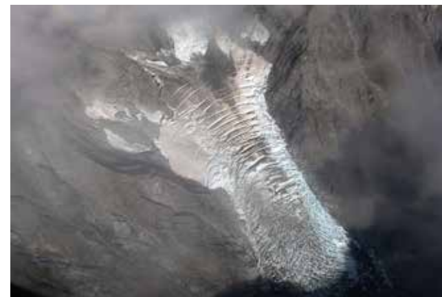
Foto: Ivana Stefaner-Weiss, zmagovalka natečaja / Gewinnerin des Fotowettbewerbs »Planine v sliki 2019«

HVALA NAŠIM PODPORNİKOM! DANKE AN UNSERE UNTERSTÜTZER!