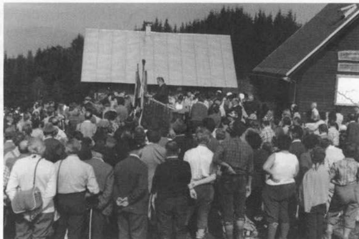
1. junij 1969